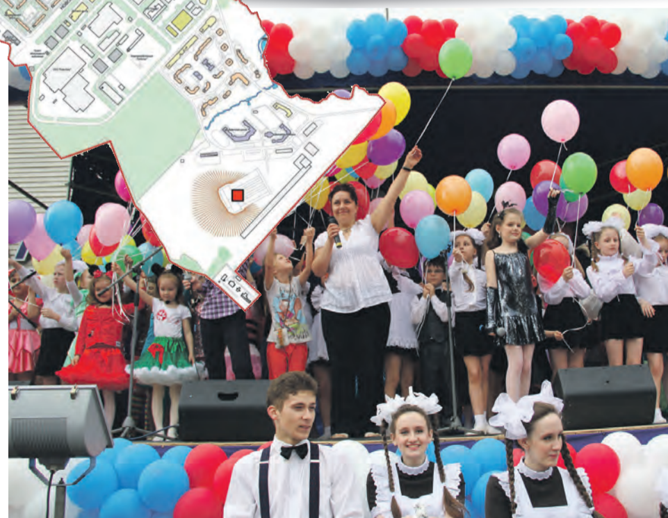
Учреждения культуры в районе представляет Территориальная клубная система (ТКС).