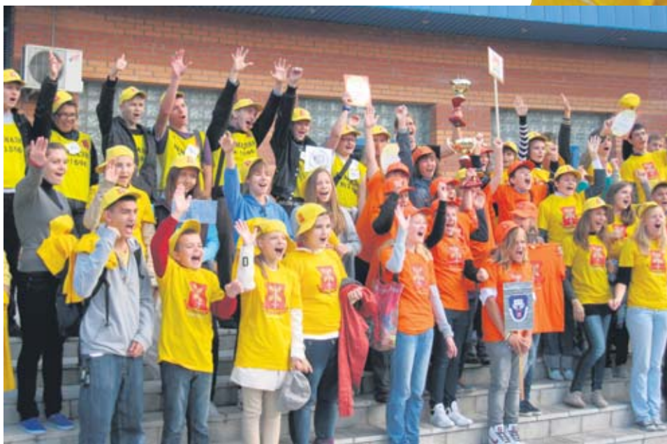
Победители интеллектуальной игры

В День города на открытой площадке у здания бассейна на улице Чоботовская была проведена интеллектуальная игра-путешествие «Переделкинский меридиан» для старшеклассников, которая посвящалась юбилею района.