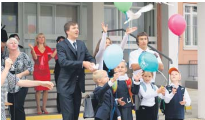
День знаний в школе № 1376.