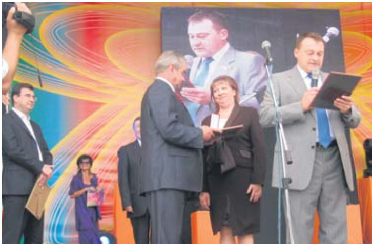
Вручение удостоверения Почетного жителя

Так называлось яркое и красочное представление, которое проходило 4 сентября у здания бассейна на улице Чоботовская. В этом году празднование Дня города совпало с еще одним важным событием – 20-летним юбилеем района Ново-Переделкино. Поэтому организаторы праздничных торжеств: и управа района, и муниципалитет, и «Территориальная клубная система «Ново-Переделкино», сделали все, чтобы порадовать жителей.