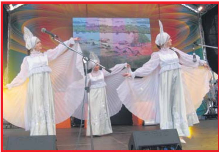
Выступает хореографический ансамбль «Нюанс»

Архитектурной гордостью нынешнего Ново-Переделкино считаются Храм Спасо-Преображения Патриаршего Подворья в Переделкино, Резиденция Святейшего Патриарха Московского и Всея Руси, Храм Благовещения Божией Матери в Федосьино, часовня и купальня Святого Филиппа.