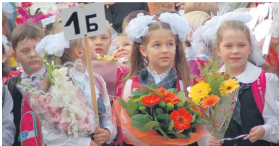
Торжественная линейка в гимназии № 1596.

В День знаний в районе Ново-Переделкино более 7 960 детей и подростков вновь сели за школьные парты. Во всех школах района прошли торжественные линейки, посвященные началу нового учебного года.