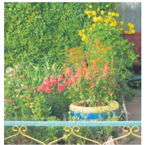
Палисадник дома № 12, корпус 2 по ул. Ск. Мухиной

В 2007 году их четвертый подъезд стал победителем в номинации «Улучшаем свое жилище» в районном этапе городского конкурса «Мой двор, мой подъезд».