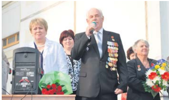
1 сентября в Центре образования № 1455.