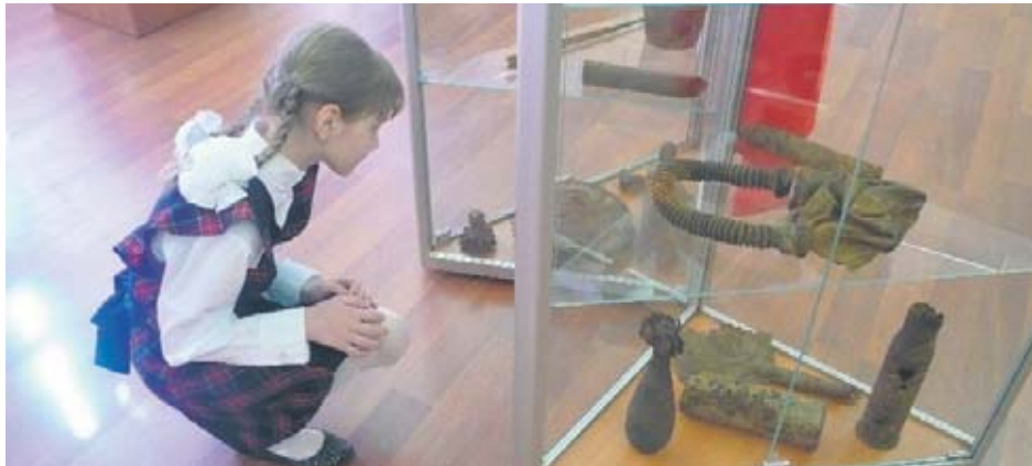
В новом музее гимназии № 1596.

К 70-летию Битвы за Москву ученики и преподаватели гимназии № 1596 подготовили и открыли музей, посвященный этому событию.