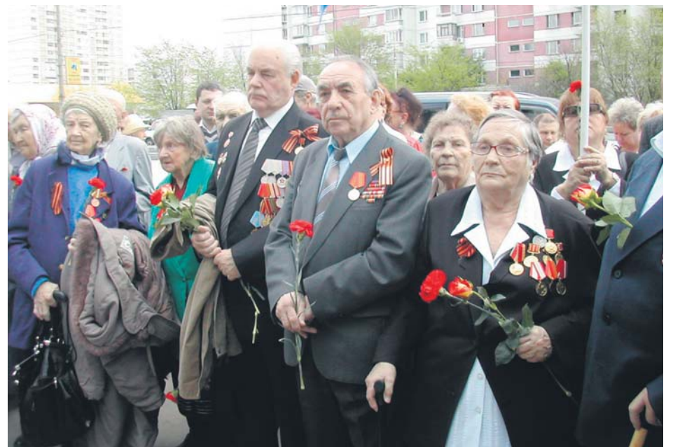
Митинг на Боровском шоссе