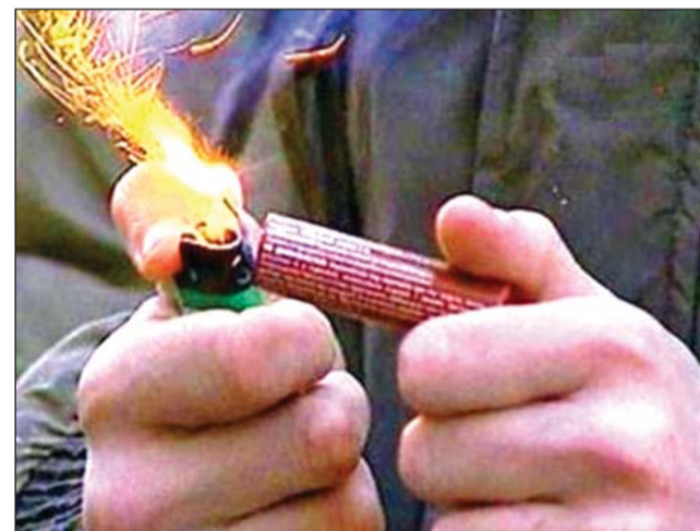
Основные признаки фальсификации пиротехники: