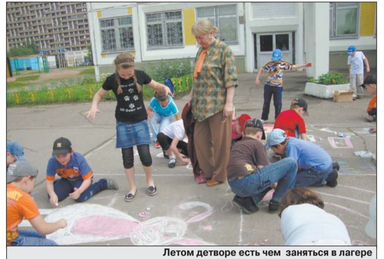
Летом детворе есть чем заняться в лагере

Большую помощь в организации работы лагеря «Солнышко» оказал центр детского творчества Ново-Переделкино. Дети посещали игротеку, где с ними проводились различные игры, экологические и туристические эстафеты,