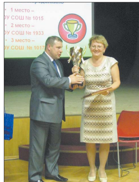
Победители X Спартакиады школьников на призы муниципалитета Ново-Переделкино

Самое активное участие приняла школа № 1015 (команды выступили в 30 номинациях), так же активно участвовали в спартакиаде школы: №№ 1933 (приняли участие в 29 номинациях), 1017, 1238 (приняли участие в 28 номинациях), 1018, гимназия 1596 (приняли участие в 27 номинациях). Муниципалитет выражает благодарность всем учителям физической культуры за организацию и проведение соревнований, подготовку команд X Спартакиады. На торжественном награждении они были награждены дипломами и подарками от муниципалитета.