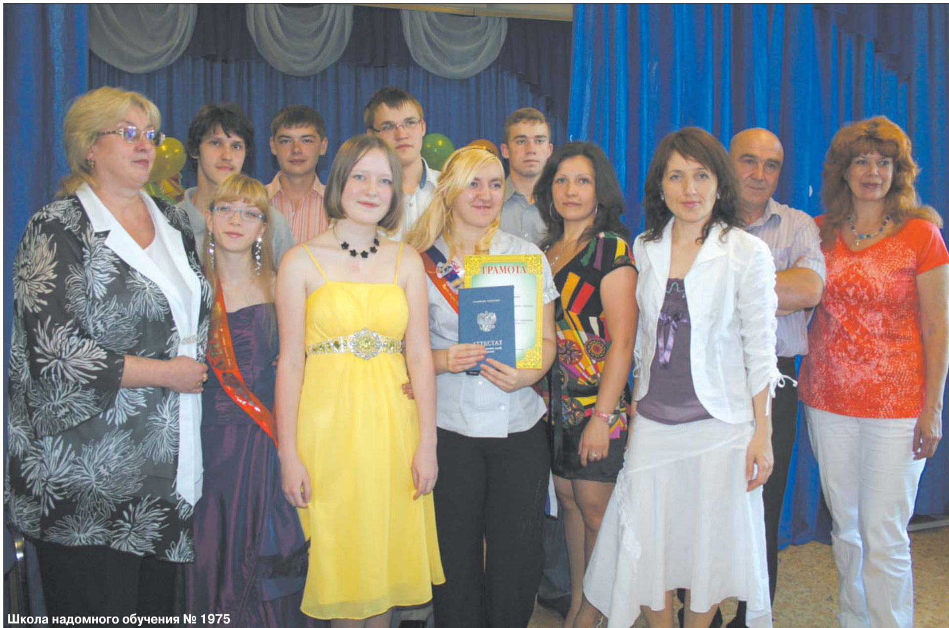
Школа надомного обучения № 1975