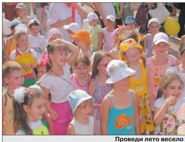
Проведи лето весело

Дни работы: 9 июня, 14 июля, 11 августа. Время работы — с 16.00 до 19.00.