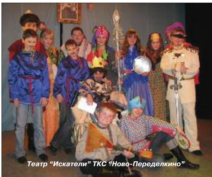
Театр «Искатели» ТКС «Ново-Переделкино»