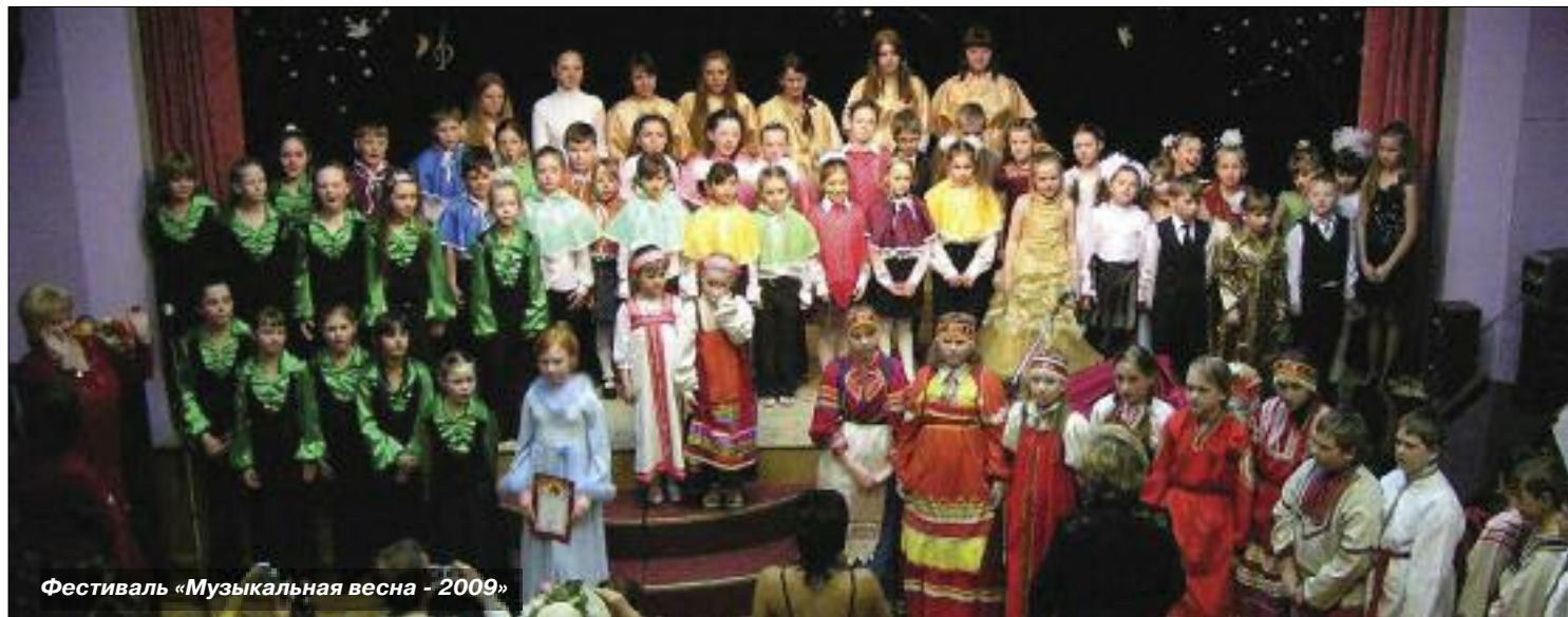
Фестиваль «Музыкальная весна - 2009»

Территориальная клубная система «Ново-Переделкино» является государственным учреждением культуры и объединяет 11 клубов района. Конечно же, основные наши посетители и кружковцы — дети и их родители. Приведу несколько цифр, характеризующих нашу деятельность. В клубах работают 345 клубных формирований, в которых занимается 3882 человека, из них 2800 — дети и подростки. Из общего числа наших юных посетителей 26 % — дети до 7 лет, 44 % — от 7 до 14 лет, 30 % занимающихся от 15 до 18 лет. Почти 22 % детей и подростков посещают наши кружки бесплатно. В 2009 году мы провели более 900 мероприятий, 472 из которых были рассчитаны на детскую и подростковую аудиторию.